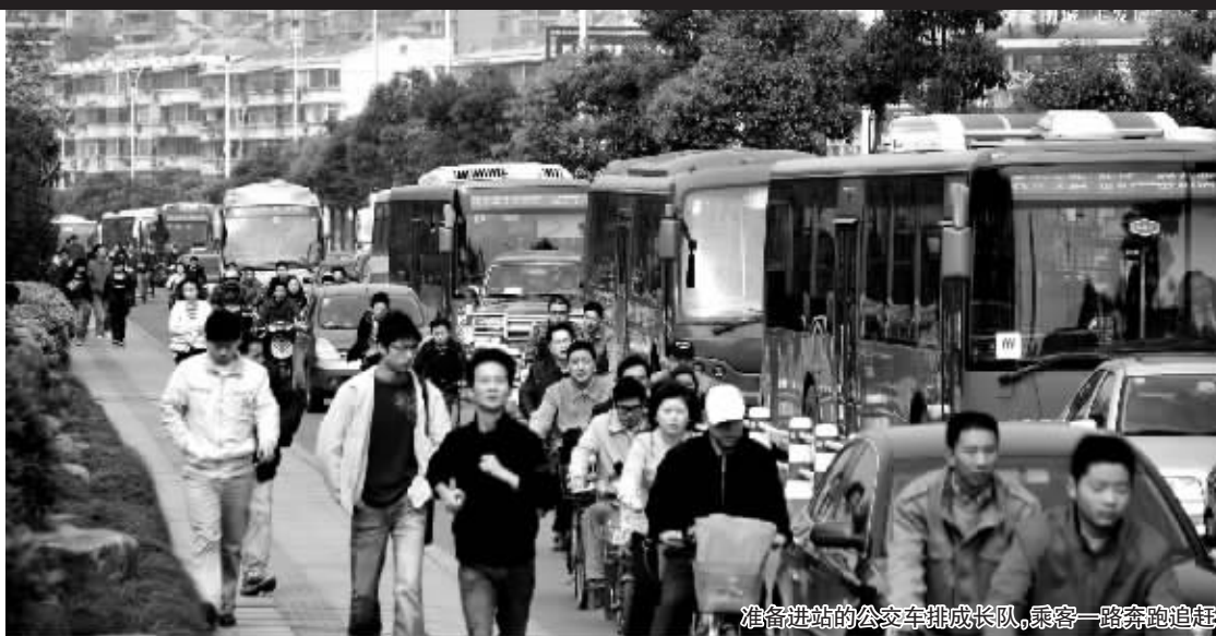
准备进站的公交车排成长队,乘客一路奔跑追赶