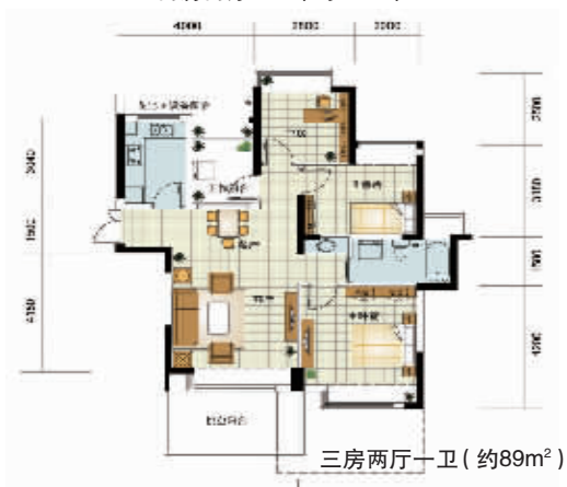
三房两厅一卫 (约89m 2 )