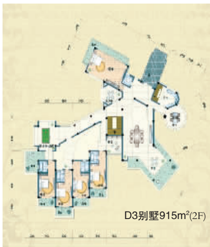
D3别墅915m 2 (2F)