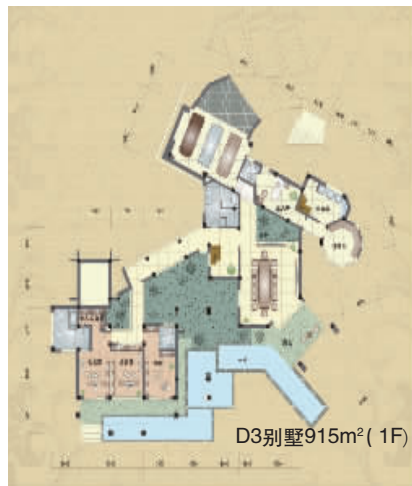
D3别墅915m 2 (1F)