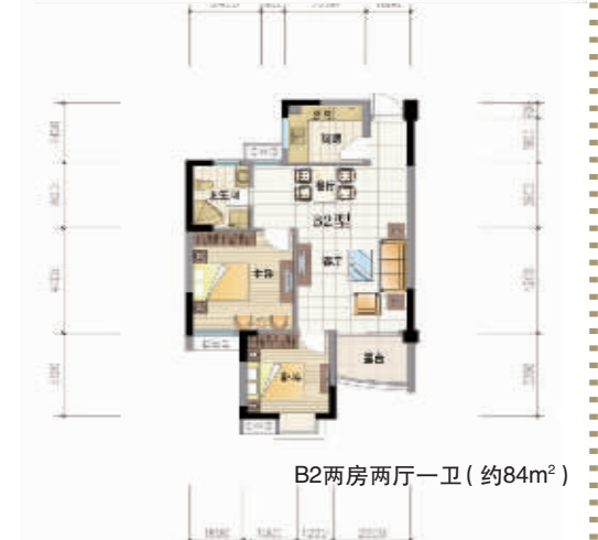
B2两房两厅一卫 (约84m 2 )