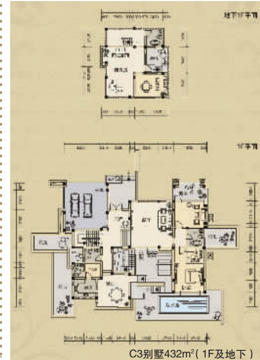
C3别墅432m 2 (1F及地下)