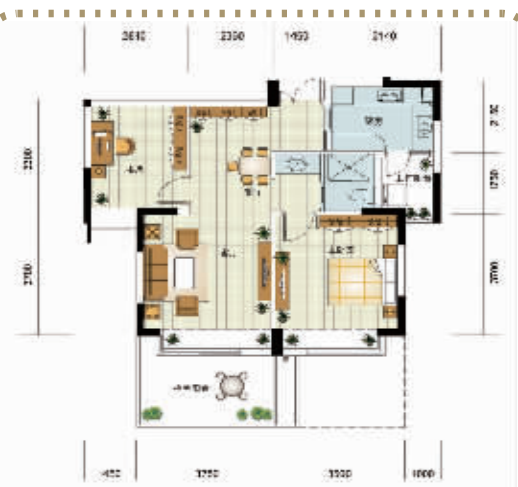
两房两厅一卫 (约75m 2 )

金都·城市芯宇不仅在阳台设计上追求生活的享受,在卧室、玄关、卫生间、走入式衣柜等设计上也做到了极度奢侈,如专用区域特配独立卫生间和通道,清晰分隔了生活空间,高尚品位立即凸显。