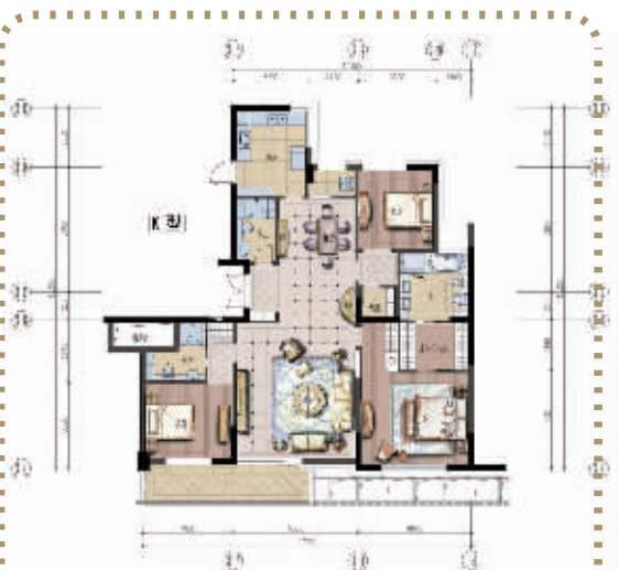
K1三房二厅三卫 (约198.99 m 2 )