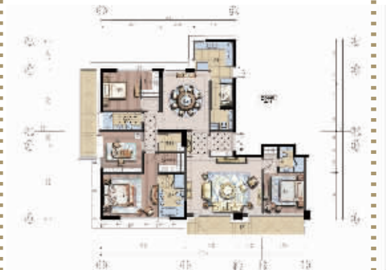
F2四房二厅四卫 (约257.13 m 2 )