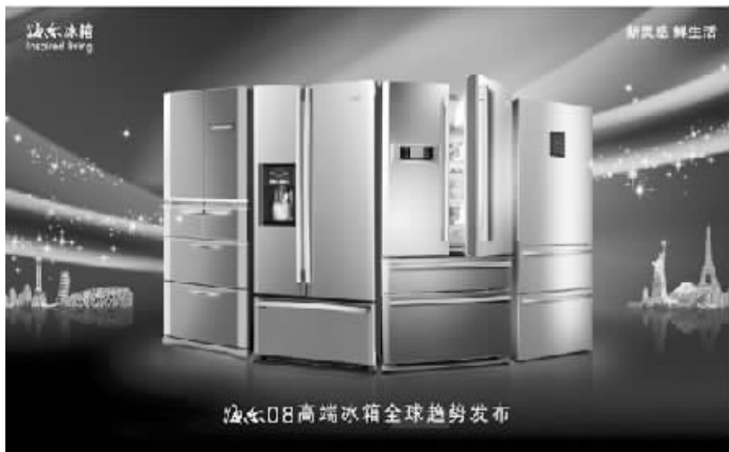
海尔08高端冰箱全球趋势发布

“我认为，海尔冰箱是最值得马上购买的品牌。”说这话的是英国冰箱问题专家西姆先生。这是在英国著名家居家电展(简称KBB)上，西姆先生作出上述评估性报告。有趣的是，西姆先生是在英国当地著名厨具商的邀请下参加KBB展，并负责对KBB展上所有冰箱品牌进行外观、性能等方面的评估，为客户提供采购报告。