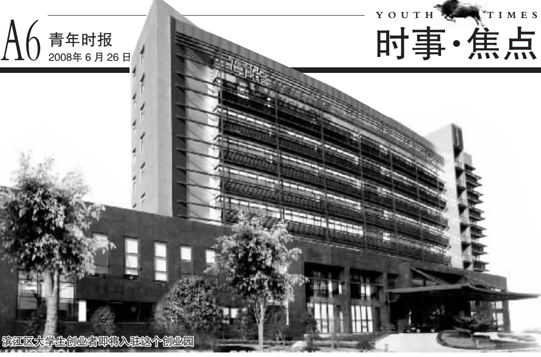
滨江区大学生创业者即将入驻这个创业园