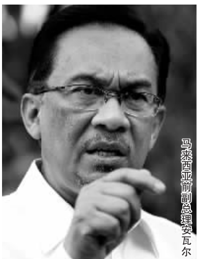
马来西亚前副总理安瓦尔

现年60岁的安瓦尔于1993年出任马来西亚副总理,1998年被革职,同年被捕入狱。1999年,他因渎职罪被判6年监禁,同年又因鸡奸罪被判9年监禁。2004年,马最高法院撤销安瓦尔犯有鸡奸罪的判决,安瓦尔当庭获释。但他的犯罪记录使得他在2008年4月之前不能参加选举和竞选政治职位。