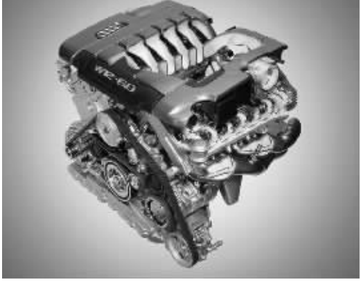
V6-V8-V12三剑客的时代或将过去

在汽车业界,厂家调查影响购车的因素选项排位中,品质排在第一位,接下来是品牌,接下来是售后维修,再次才是车价。但是,在6月20日油价上调了8毛之巨并且预期下半年还将有可能多次上调之后,油耗这一因素已经迅速蹿升,时报上周委托杭州沃克企业管理咨询有限公司的一份样本为有购车意向的300人的调查中,油耗暂时成为了影响人的第一因素。 □时报记者 章国瑜