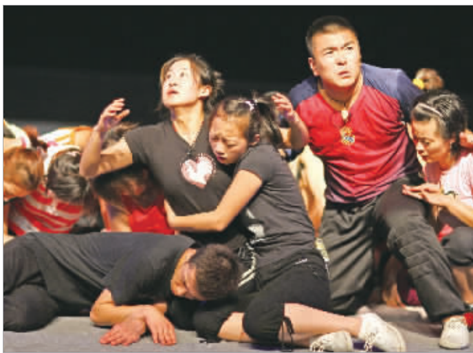
本月23日,时报京剧票友会上,演员们不带妆表演的片段