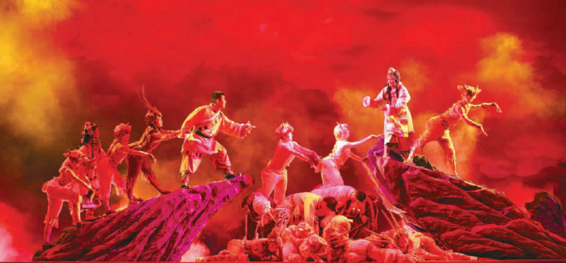
这是剧中最感人的一幕,志愿者和藏羚羊群遭遇到雪狼追杀,逃跑时遇到悬崖,老藏羚羊跳下悬崖填满沟壑,让小羊群和志愿者踩着它们的身体通过