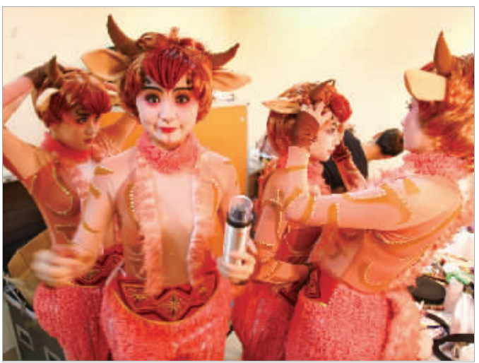
7月28日晚上,《藏羚羊》着装彩排