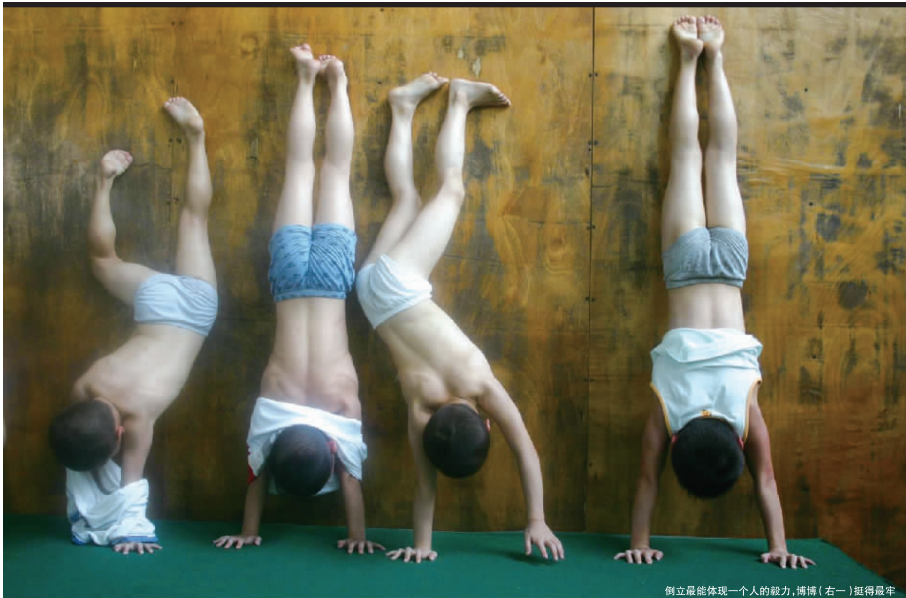
倒立最能体现一个人的毅力,博博(右一)挺得最牢