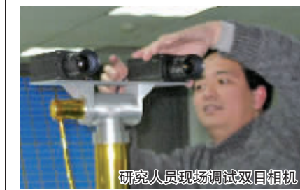
研究人员现场调试双目相机

航系统有四组八只“眼”即摄像头,脑袋上”一组导航、一组全景,机身前后还各有一组避障摄像头,导航摄像头负责“指方向”,即根据太阳高度角找到方向,即“找北”,全景摄像头可以360度全景观测,可以“看”到100米半径以内的范围,至于避障摄像头,它就短视了点,大约只能“看”4米,但基本能看到180度范围内。有了这八只“眼”,每次走时,月球车先是用全景“眼”360度扫描一圈,然后用前后的避障“眼”仔细地“巡逻”,基本是走一走,停一停。即使一不小心一只眼失灵了也不怕,因为他们同时也在进行“单目视觉研究”,以防万一。