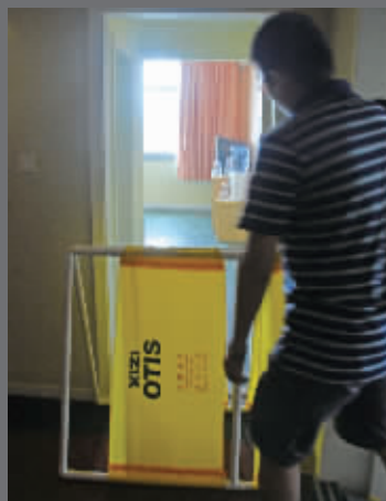
事发酒店客房已被封锁