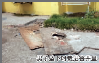
一男子坠下时栽进窰井里