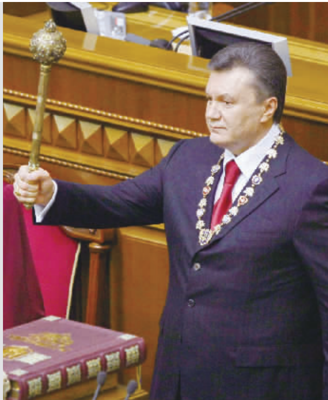
亚努科维奇宣誓就职

在乌克兰当选总统亚努科维奇2月25日就职前夕，他的政敌、总理季莫申科依然态度强硬，毫不退让。据美国媒体报道，季莫申科2月24日晚在一次会议上表示，亚努科维奇的“地区党”在议会没有控制足够的议席，无力解散政府。而“地区党”副主席格尔曼则称，亚努科维奇绝对不会与季莫申科一道工作。格尔曼表示：亚努科维奇做总统和季莫申科做总理不可能同时并存。今年春天，我们将会迎来一名新总理，这名新总理考虑的不是个人野心和把持权力，而是这个国家。”