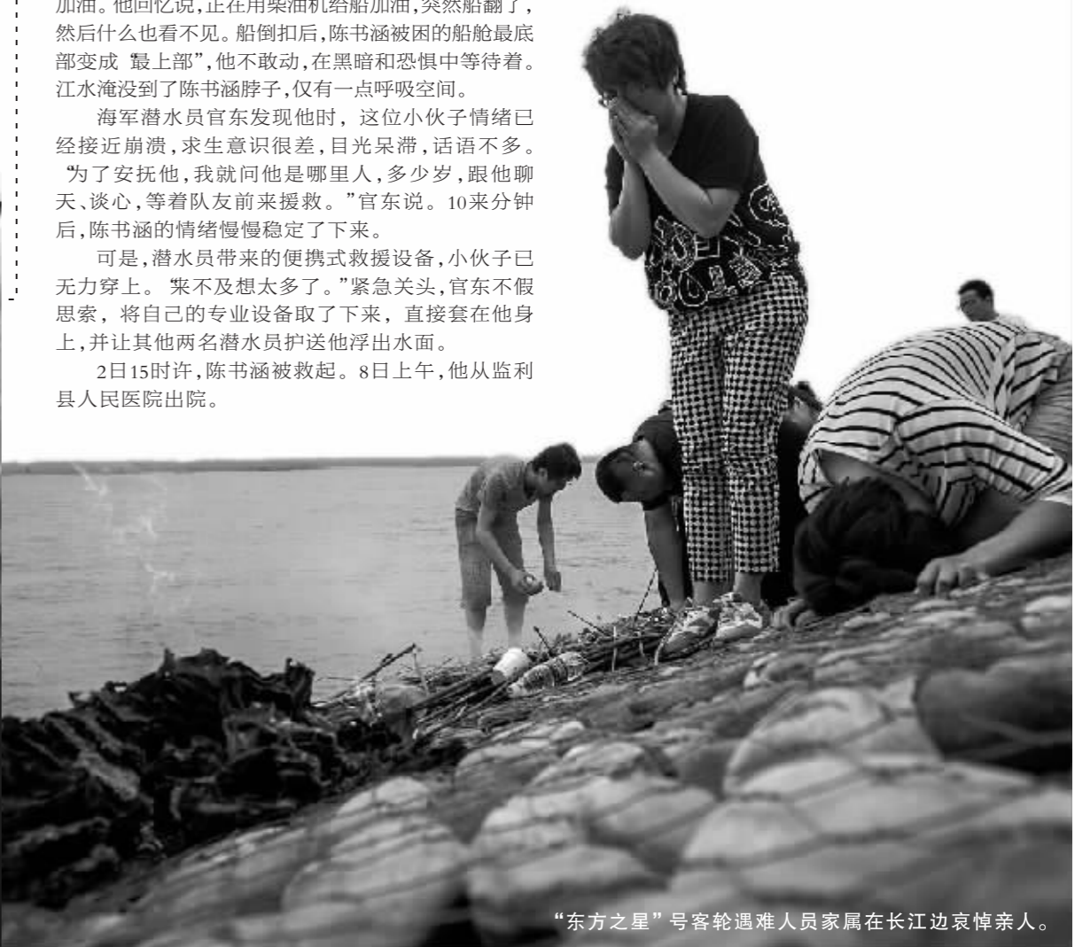
“东方之星”号客轮遇难人员家属在长江边哀悼亲人。