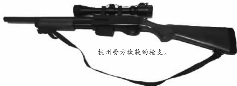
杭州警方缴获的枪支。

对话中的买家并不是宠物爱好者,卖家也不是卖狗粮的,他们在微信群里以“狗”代称枪支,长枪叫“长狗”,手枪叫“短狗”,“狗粮”就是子弹。杭州警方发现涉枪线索后,全国“寻枪”,接连破获多起网络制贩枪支案件,彻底铲除多条网络贩枪的黑色产业链。