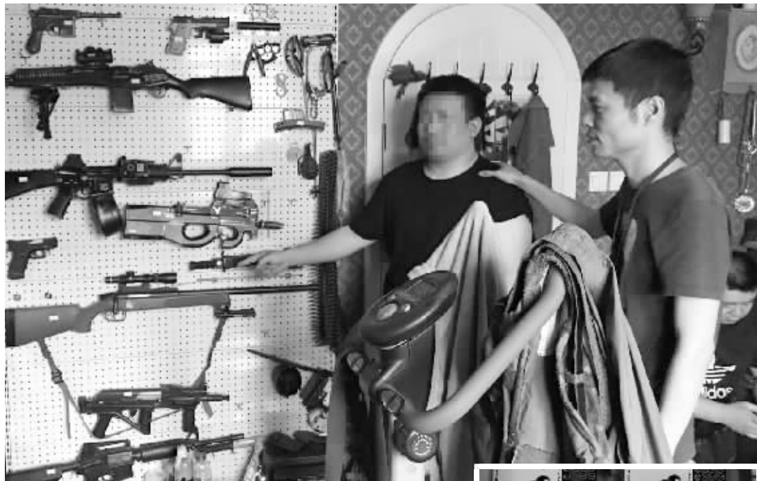
小吴通过网络购买的枪支。