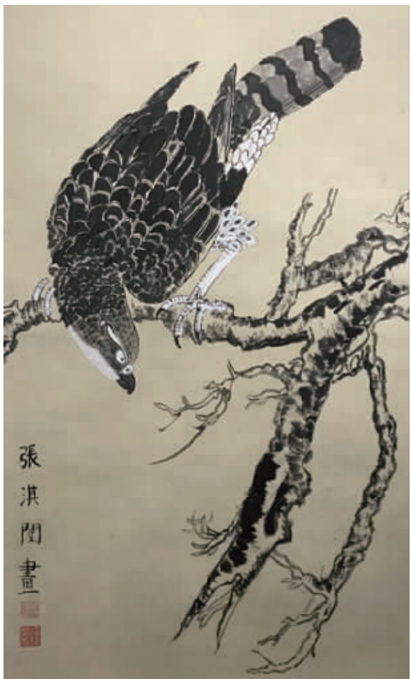
《鹰》牛通社记者 张淇闵 求知小学 506班

作品属于国画花鸟画,用到了传统的国画手法,整体构图呈现出剑拔弩张的气势。在老鹰身上的用笔强劲有力,树枝上用到枯笔的技法,生动有趣,可以看出小作者有比较好的国画功底。老师建议在树枝末梢的处理上,可以做一些虚化处理会更好。