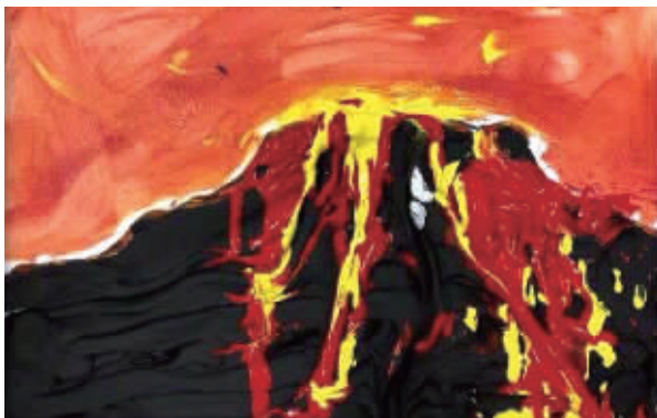
《流淌的岩浆》牛通社记者 刘懿轩 东新实验幼托园 苗苗一班

作品属于平面插画,整体风格清新简约。小作者用到了很多的绘画技法,画面中用到版画拓印,表现古风人物和鼎的剪影。画面的外围用到了线描手法,还有很多的穿插,整体层次丰富,色彩搭配合理。希望今后可以画出更多的好作品!