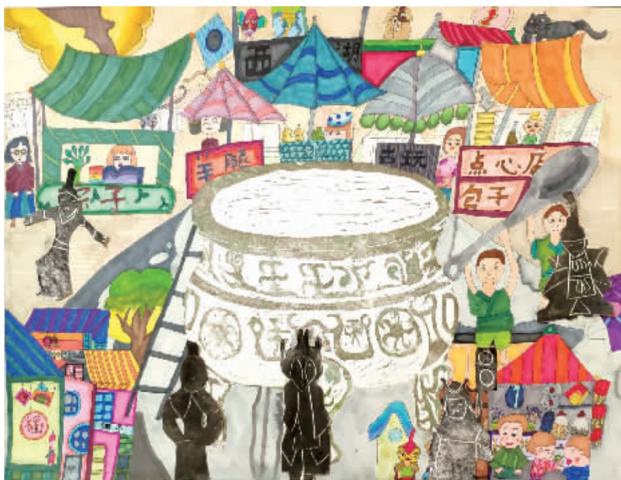
《快乐迎新年》牛通社记者 阴悦 育才外国语学校 304班

作品属于国画山水画,用到了传统的国画技法,整体构图完整,山水穿插有序。老师建议注意用墨,浓淡控制,可以用细笔浓墨把握细节的处理。