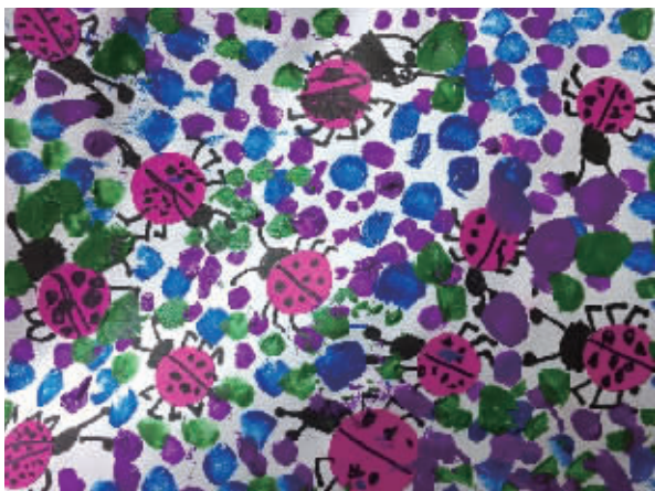
《七星瓢虫找朋友》牛通社记者 金瑞佳 笕桥第五幼儿园 小一班

作品属于色彩装饰画,整体画面简洁大气,火山形象感强烈。画面用到了多种材料,使得火山有一定的立体感,天空的笔触感强,伴随有飘散出一些星火,可以看出小作者很好地表现出了火山喷发时的瞬间。